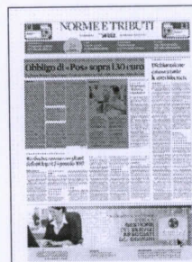
Peso: 1-3%, 27-22%

Difficile a questo punto prevedere i tempi, anche perché oltre alla risposta di via Nazionale occorrerà anche ottenere il concerto del ministero dell'Economia. Nel frattempo, allo scopo di evitare il caos interpretativo sulla data del 1°